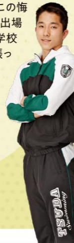
第73回三重県高等学校総合体育大会 【男子総合】第2位 50m・100m・400m・1500m自由形各種目2位(各種目東海大会出場) 【女子総合】第3位 200m自由形2位(東海大会出場)・400m個人メドレー2位(東海大会出場)