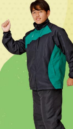
第73回三重県高等学校総合体育大会 【男子】走幅跳8位・1500m7位・5000m2位 (東海大会出場)