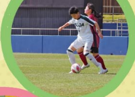
第73回三重県高等学校総合体育大会 第3位

私たち女子サッカー部は、県大会優勝を目標に日々の練習に励んでいます。今回の県総体では3位という成績を残すことができました。今まで積み重ねてきた日頃の練習の成果を発揮できるよう精一杯戦いましたが、目標としていた県大会優勝を達成することができず、悔いの残る結果となりました。新チームで挑む夏の皇后杯、冬の選手権では目標である県大会優勝を目指して頑張ります。日頃の練習を無駄にせず、意味のあるものにしたいです。そして選手一人一人がチームの一員であることを意識し、全員で切磋琢磨しあって取り組んでいきたいです。応援してくださる方々やお世話になっている方々に感謝の気持ちをもち、最後まで戦い抜きます。